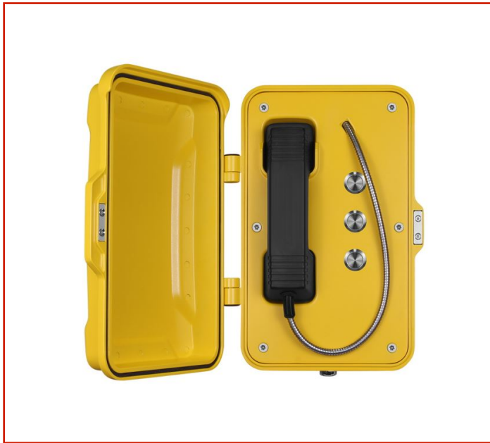
Teléfono resistente a la intemperie

Modelo: JR101-3B : Están diseñados para ser utilizados por los ferrocarriles, las centrales eléctricas, los servicios armados y la industria pesada que requieren una telefonía muy fiable en condiciones adversas.